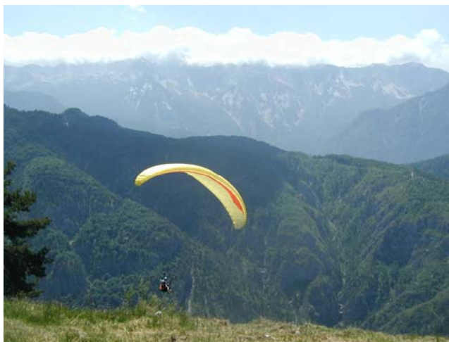
Il "Bimbo" voltegga davanti al decollo del Jama