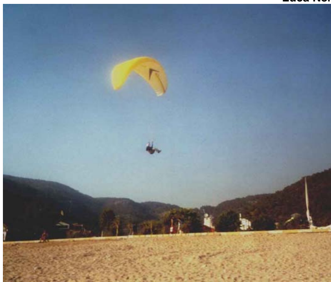
in atterraggio sulla spiaggia di Olu Deniz