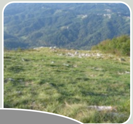
in alto Foto del decollo “in Volo”